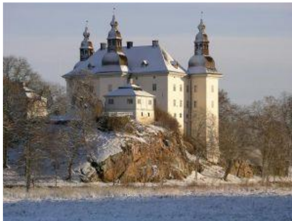
Ekenäs Slott

Det är 20-års jubileum med mycket aktiviteter till ett ganska lågt inträdespris för publiken.