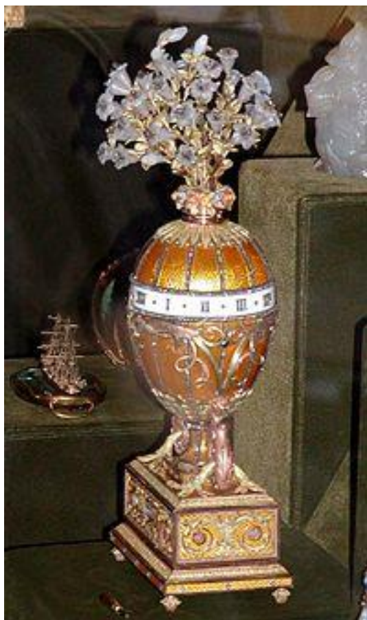
Madonna med Liljor/Fabergé

I detta nummer kan du läsa om nya lokaler, årsmötet, resor och utflykter samt kurser m.m.